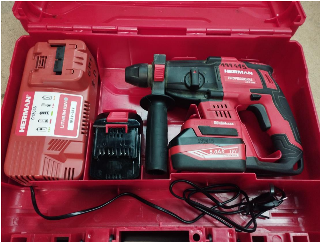
Obr.1 Stav náradia pri prijme