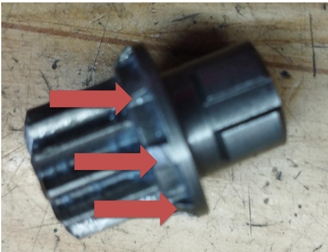
Obr.2 Poškodenie ozubeného prevodu