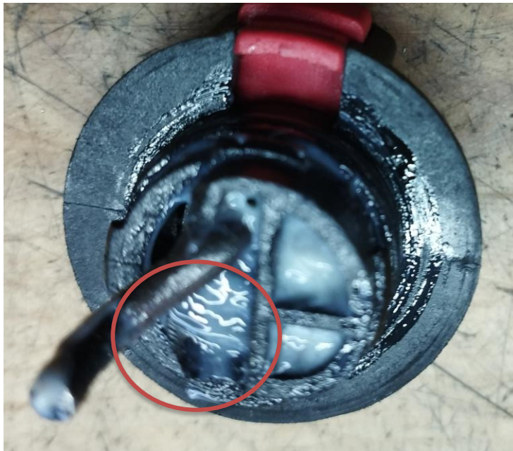
Obr.4 Poškodenie prepínača funkcií