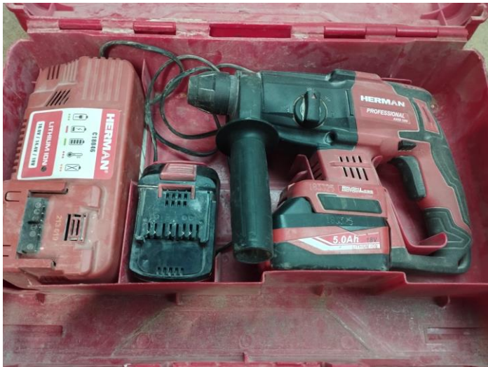
Obr.1 Stav náradia pri prijme