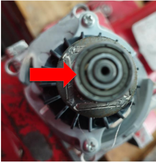
Obr.3 Poškodenie ložiska