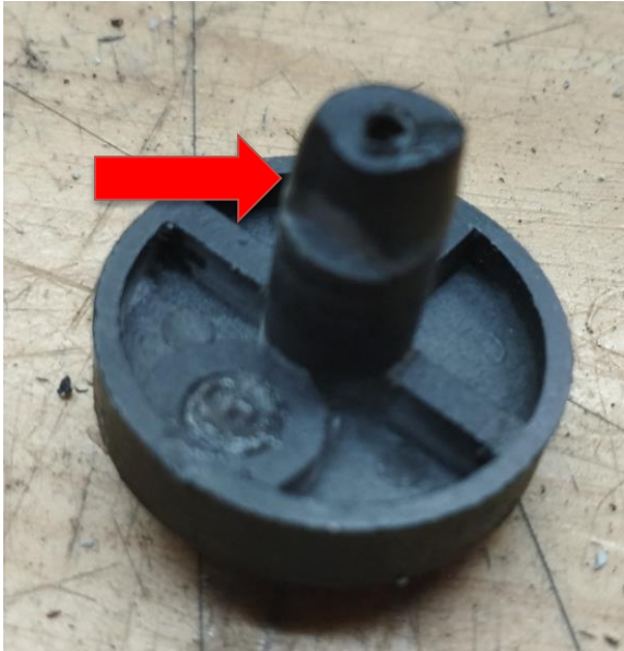
Obr.3 Poškodenie prepínača prevodových stupňov