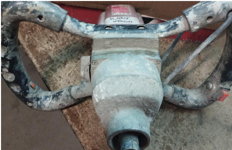
Obr.1 Stav náradia pri prijme