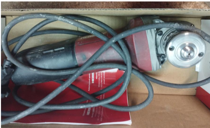
Obr.1 Stav náradia pri prijme