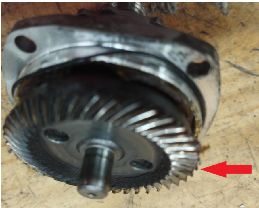
Obr.2 Opotrebenie ozubeného prevodu